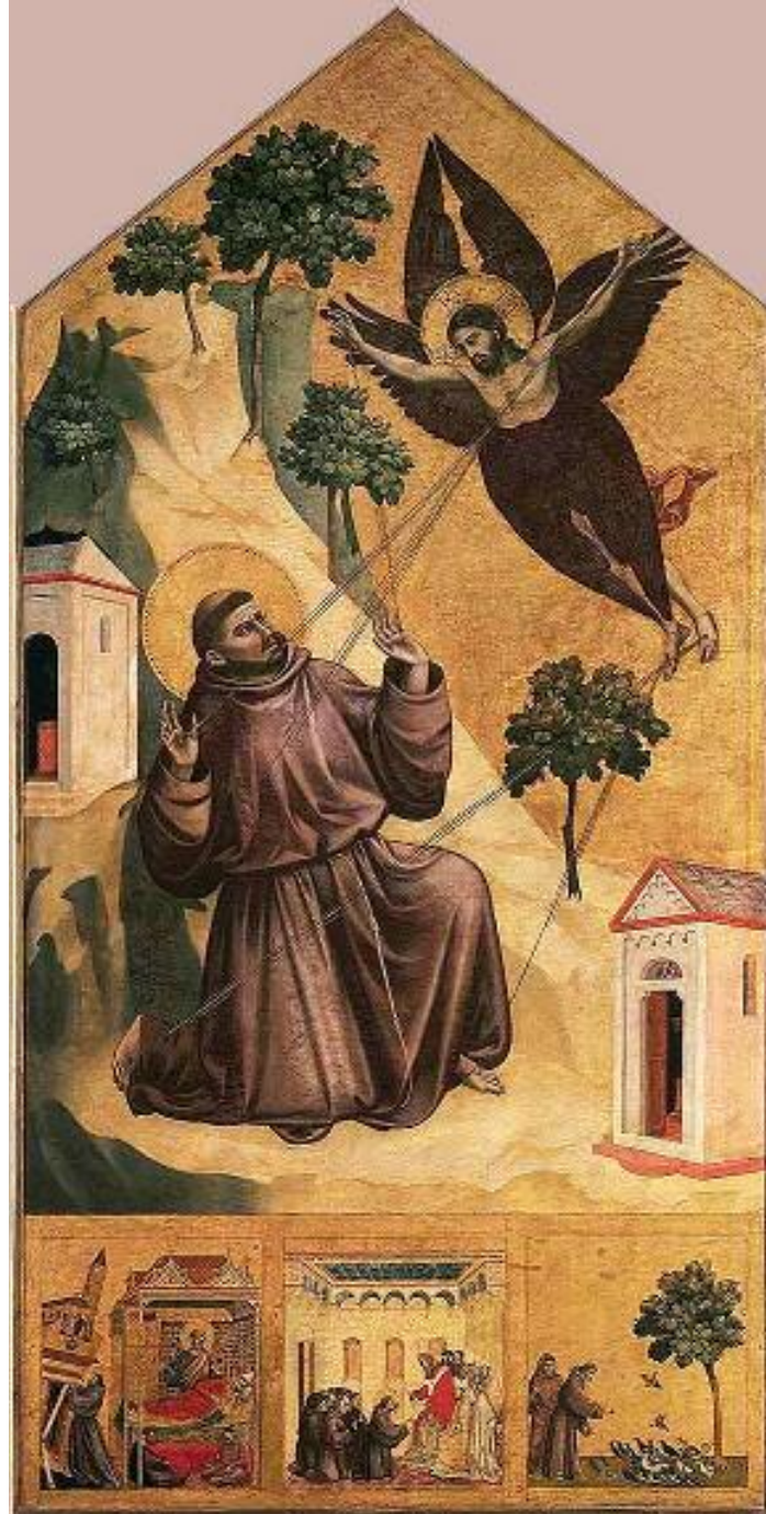
جیۆتۆدی بۆندۆنی Giotto di Bondone

هونەری ئەوروپی سەدەکانی ناوەراستی و پێنسانس ٢٥٥